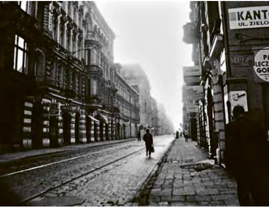
LODZ SYMPHONY (Peter Hutton, USA 1994)

Zwei Filme von Peter Hutton: BUDAPEST PORTRAIT - MEMORIES OF A CITY (USA 1986 | 18.10.) & LODZ SYMPHONY (USA 1994 | 18.10.) Städteporträts, Landschaftsbilder, Meereseerkundungen: Über vier Jahrzehnte hat der Maler, Fotograf, Kameramann und Regisseur Peter Hutton meditative, brillant fotografierte, tagebuchartige Studien von Orten auf der ganzen Welt geschaffen. Präzise beobachtet, in langen Einstellungen, auf 16 mm und stumm gedreht, sind einige seiner Filme „städtische Erkundungstouren, angelegt zwischen Reisebericht, Weltvermessung und montierter Erinnerung. In BUDAPEST PORTRAIT wird Huttons Idee einer ‚naturalisierten‘ Textur artifiziell-urbaner Landschaften manifest, das Chiaroscuro des Winterlichts, ein Gefühl von Einsamkeit und Isolation. LODZ SYMPHONY beschwört eine längst vergangene Atmosphäre herauf, bevölkert nur von den Geistern der polnischen Geschichte.“ (Viennale) SUNRISE: A SONG OF TWO HUMANS (Sonnenaufgang - Lied von zwei Menschen, F. W. Murnau, USA 1927 | 19.10., am Flügel: Eunice Martins) Ein Film der Leuchtspuren, der Elektrifizierung, der Schatten und Schattierungen. Gemeinsam mit seinen Kameramännern Charles Rosher und