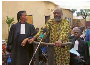
Terms and Conditions #02: Kontinuität von Kolonialität und (neo)kolonialem Rechtsgeschehen → 22