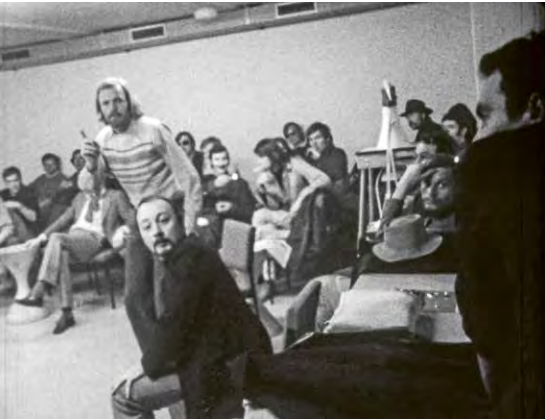
REQUIEM FÜR EINE FIRMA (Gruppe Wochenschau, BRD 1969)