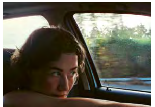
Die DEFA-Stiftung präsentiert: IVO → 24