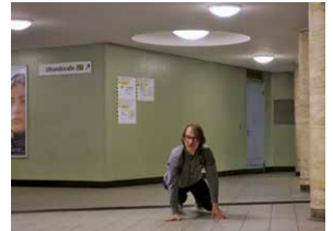
Filmmakers' Choice: Papilio ludo, ergo sum → 23