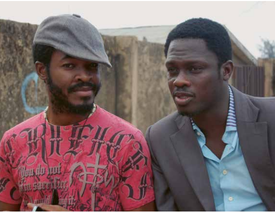
CONFUSION NA WA (Kenneth Gyang, Nigeria 2013)

THE SEARCHERS (Der schwarze Falke, John Ford, USA 1956)