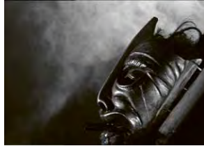
Magical History Tour High Contrast – Variationen des Chiaroscuro im Schwarz-Weiß-Film (2) → 19