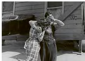
Großes Kino, kleines Kino #71: Selbermachen – Eine kurze Reise durch die Filmmaterialien → 23