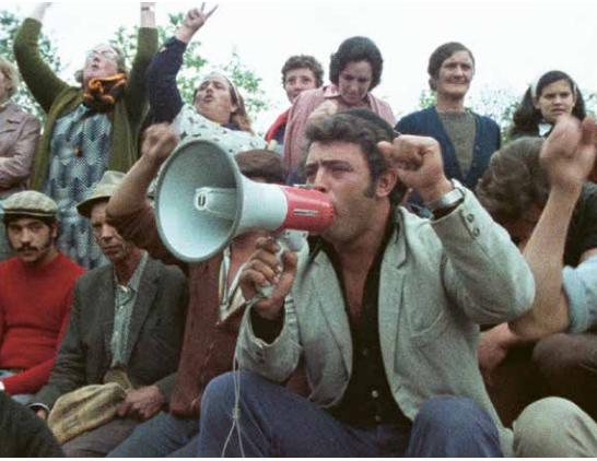
TORRE BELA (Thomas Harlan, Portugal/BRD/Liechtenstein 1977)