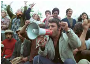
Film Restored: Community → 14