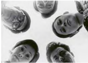
Zwischen Golden Age und Nouvelle Vague Neue Blicke auf die japanische Filmgeschichte → 4