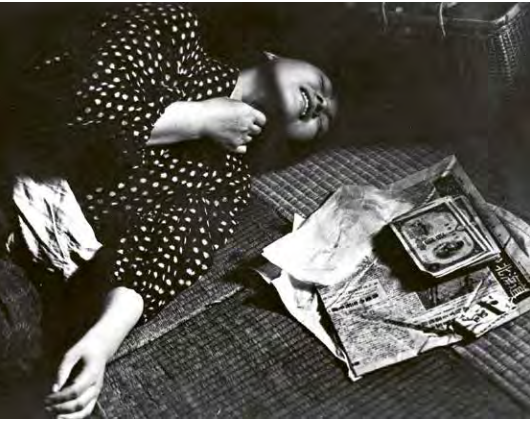
ONIBABA (Die Töterinnen, Kaneto Shindo, Japan 1963)