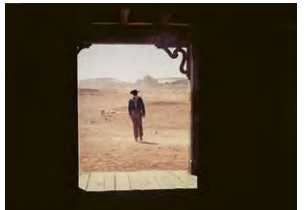
70 mm: THE SEARCHERS → 25